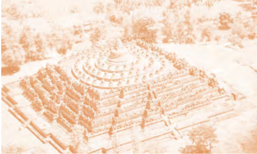
Gambar 2.12 Candi Borobudur