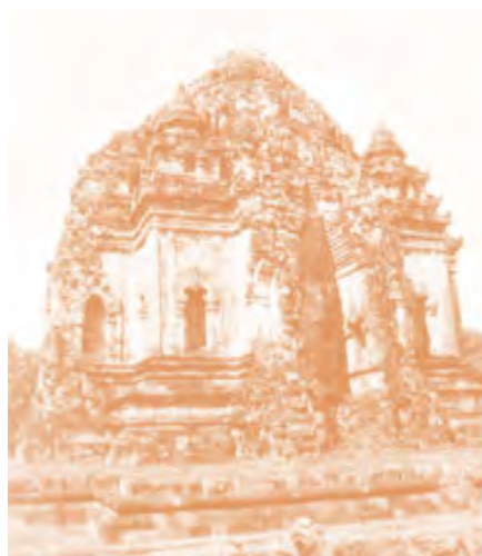
Gambar 2.10 Candi Kalasan

Prasasti Kalasan juga menerangkan bahwa Raja Panangkaran disebut dengan nama Syailendra Sri Maharaja Dyah Pancapana Rakai Panangkaran. Dalam Prasasti Kalasan yang berangka tahun 778 M, Raja Panangkaran telah memberikan hadiah tanah