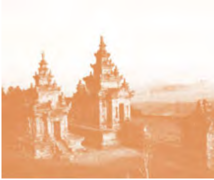
Gambar 2.11 Kompleks Percandian Gedongsongo, terletak di Kabupaten Semarang, Jawa Tengah

Sumber : Direktorat Geografi Sejarah. Atlas Sejarah Indonesia Masa Klasik (Hindu-Buddha) . Kementerian Kebudayaan dan Pariwisata. 2010