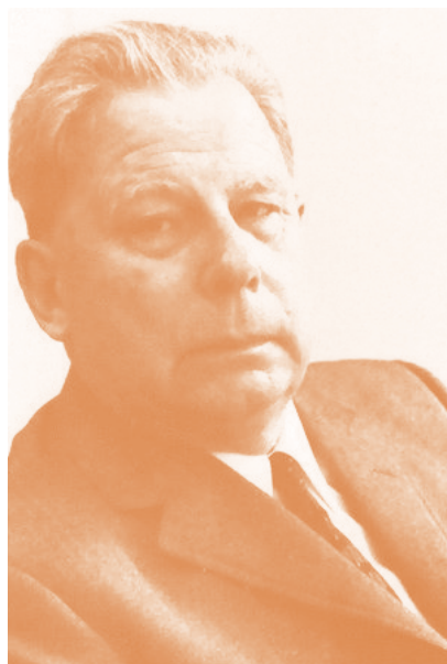
Gambar 2.1 Von Koeningswald