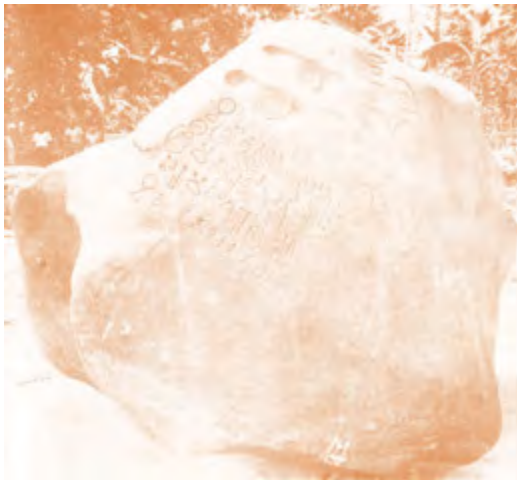
Gambar 2.8 Prasasti Ciareteun