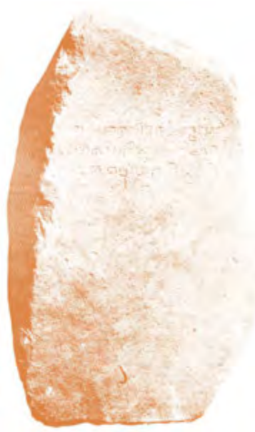
Gambar 2.7 Prasasti Kebon Kopi I