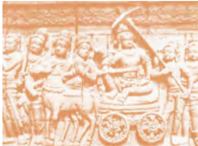
Gambar 2.13 Rupadhatu