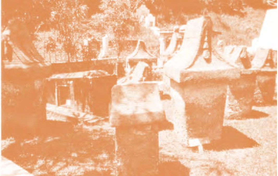
Gambar 1.1 Waruga