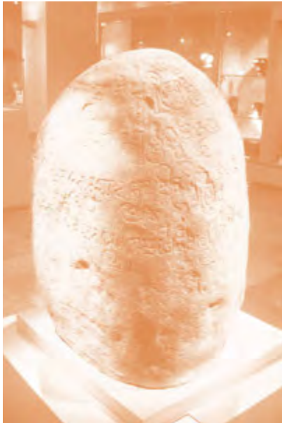
Gambar 2.6 Prasasti Tugu