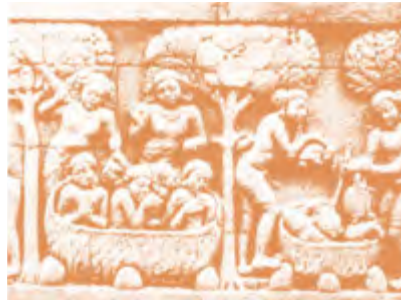
Gambar 2.14 Kamadhatu