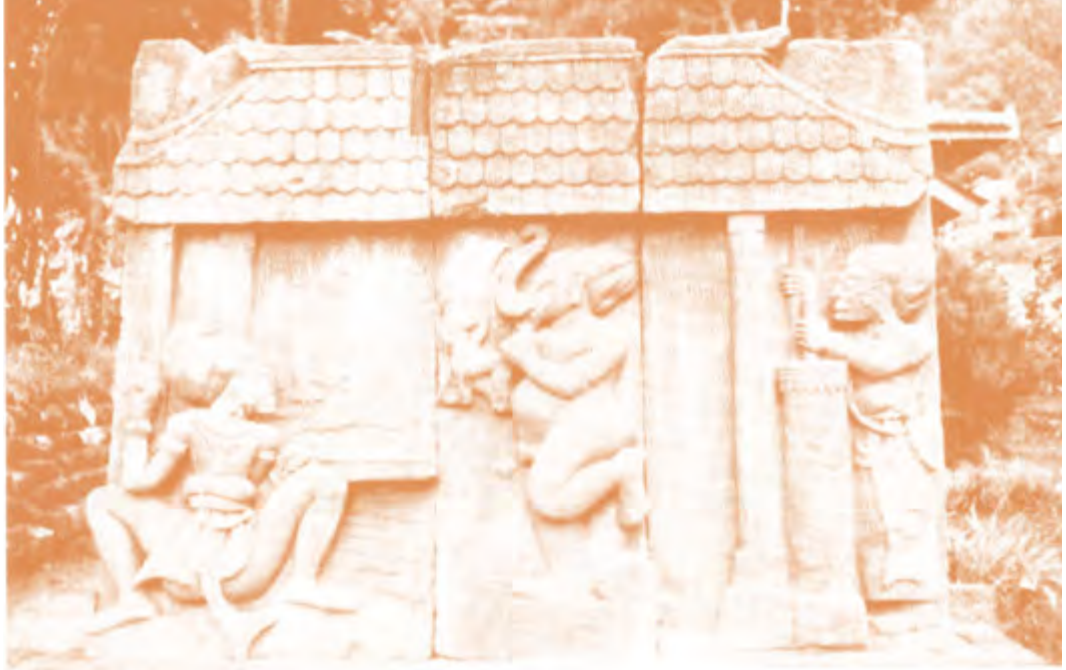
Gambar 2.1 Relief yang menggambarkan aktifitas pandai logam

Sumber : Bambang Budi Utomo. 2010 Atlas Sejarah Indonesia Masa Klasik (Hindu-Buddha) . Jakarta: Kementerian Kebudayaan dan Pariwisata.