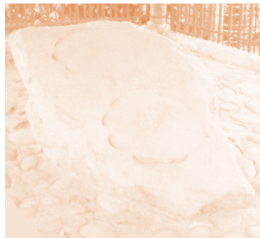
Gambar 2.9 Prasasti Kebon Kopi II