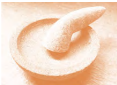
Gambar 2.3 Cobek, peralatan dari batu yang masih digunakan sampai sekarang

Sumber : Florentina Lenny Kristiani dalam http://klubnova.tabloidnova.com/KlubNova/Artikel/Aneka-Tips/Tips-Rumah/Cara-pilih-cobek-batu diunduh tanggal 19 Mei 2013, pukul 10:09