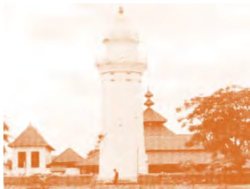
Gambar 2.15 Masjid Agung Banten