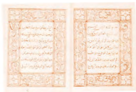
Sumber: Bambang Budi Utomo. 2011. Atlas Sejarah Indonesia Masa Islam . Jakarta: Kementerian Kebudayaan dan Pariwisata.